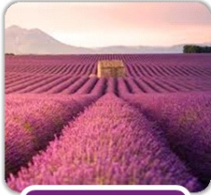
dans le sud de la France

2 Où est-ce que Stéphanie est partie en vacances ?