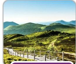
dans le centre de la France