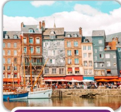
dans le nord de la France